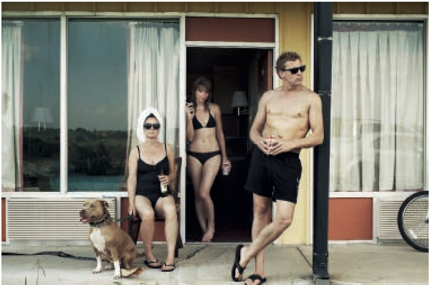
Groepsportret, ©Robin de Puy/Courtesy the Ravestijn Gallery