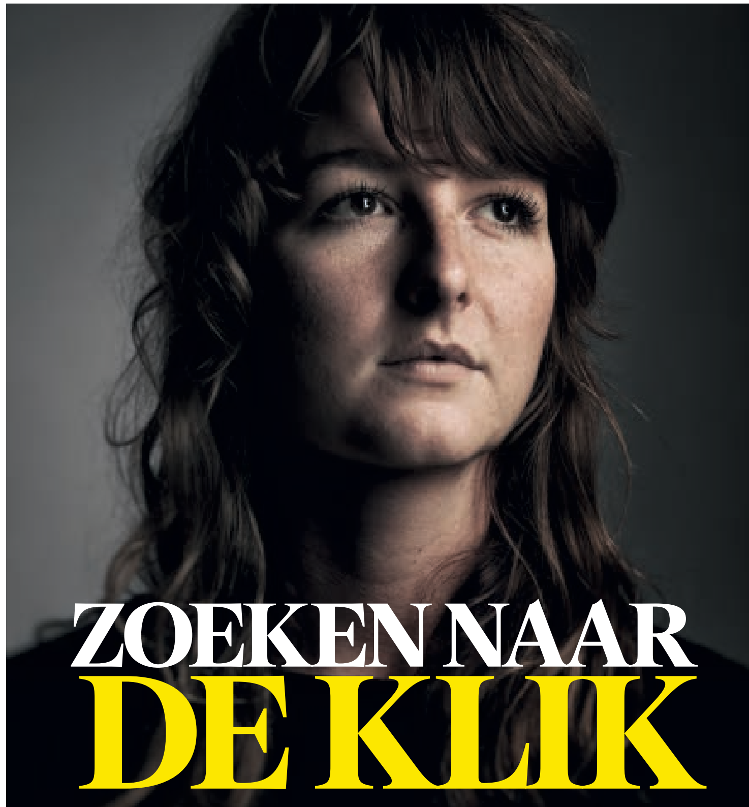
Portret Robin de Puy

Om zichzelf en haar vak te herontdekken, trok fotografe Robin de Puy vorig jaar op de motorfiets drie maanden door Amerika. De weerslag daarvan – het contact met wildvreemden, de hotelkamers, de zelfportretten – is deze maand te zien in een tentoonstelling en een documentaire.