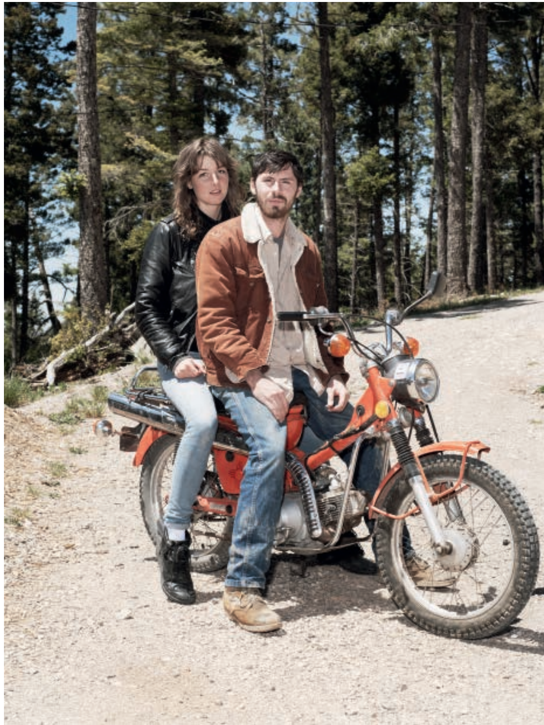
With Graden

Om te ontdekken wat portretfotografie ook alweer is en wat haar persoonlijke drijfveren zijn, stapte ze vorig jaar op de motorfiets om drie maanden door Amerika te toeren. Zonder concreet plan, met als enige zekerheid dat elke ochtend de Harley Davidson op haar stond te wachten. Een camera plaatst alles in een kader. Raamstijlen in een auto doen dat ook. Op een motorfiets is elke omlijsting weg. Omringd door geuren en geluiden, overgeleverd aan zon, wind en regen met het wegdek vijftien centimeter onder je voeten heb je alle gelegenheid om de blik te verruimen. En, leerden wij van Loesje-van-de-posters: Een wijde blik verruimt het denken.